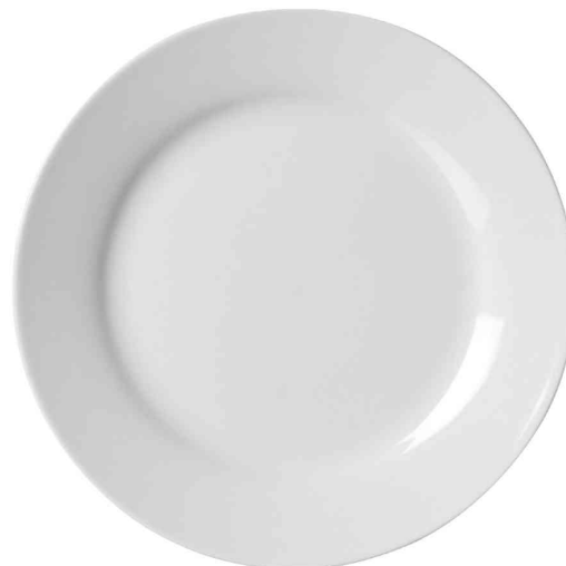
Assiette à dessert BIANCO