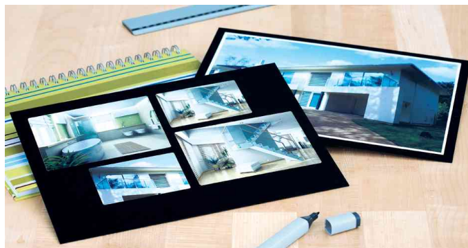
Étiquettes brillantes SPECIAL, utilisation