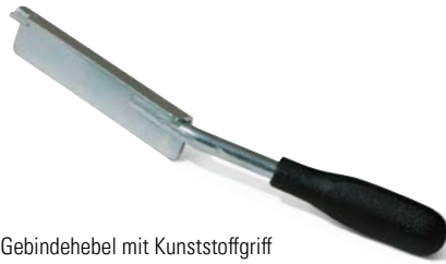
Gebindeheber mit Kunststoffgriff