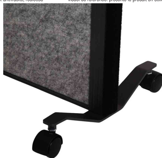
Vue détaillée: roulettes