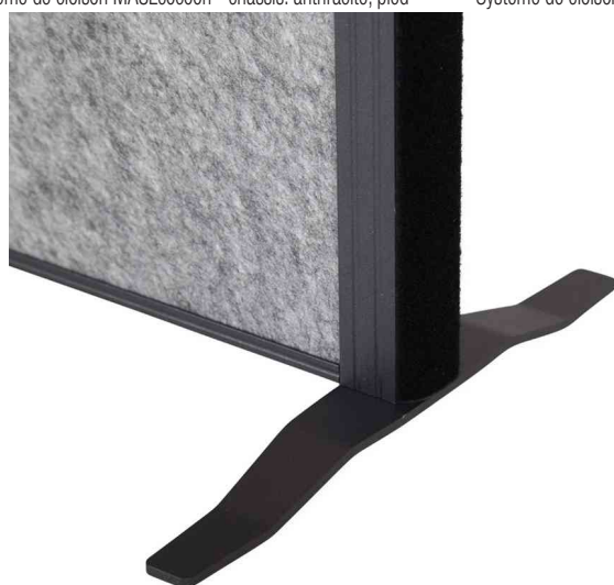
Vue détaillée: pied