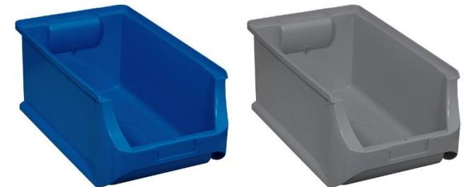
ProfiPlus Box >RE< 4