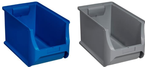
ProfiPlus Box >RE< 4H