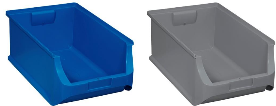
ProfiPlus Box >RE< 5