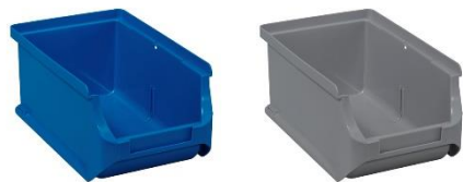
ProfiPlus Box >RE< 2

Stapelsichtboxen in Industriequalität aus recyceltem Kunststoff Industrial quality stackable bins made from recycled plastic