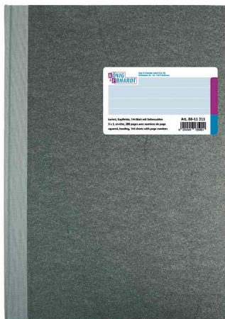
Livre de compte format A4, couverture rigide