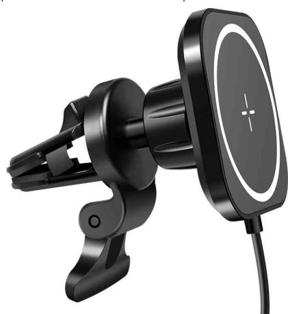
Support magnétique/chargeur de smartphone pour voiture