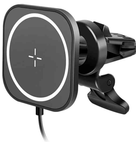
Support magnétique/chargeur de smartphone pour voiture