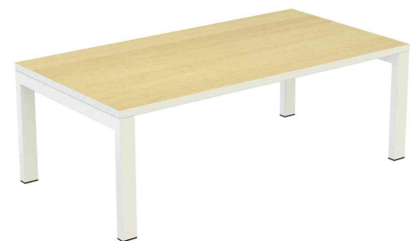
Loungetisch easyDesk rechteckig, buche / weiß