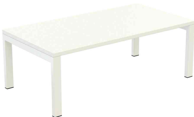
Loungetisch easyDesk rechteckig, weiß / weiß