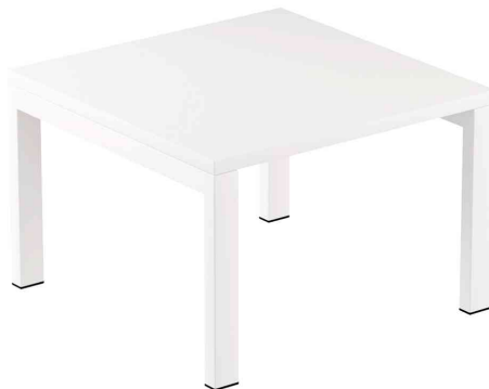
Loungetisch easyDesk quadratisch, weiß / weiß