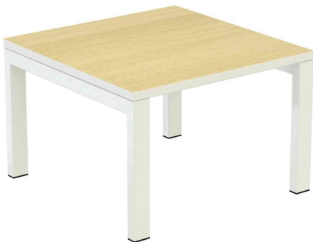
Loungetisch easyDesk quadratisch, buche / weiß