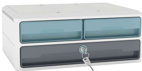
Schubladenbox MoovUp Secure, 3 Schübe, minz/grau