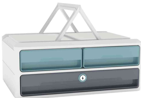
Schubladenbox MoovUp Secure, minz/grau, mit Tragegriffen