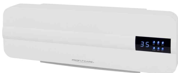
Wand-Keramik-Heizlüfter PC-HL 3116