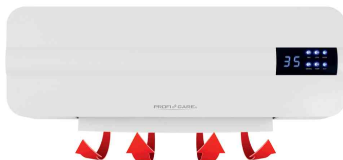
Detailansicht: zuschaltbare Swing-Funktion