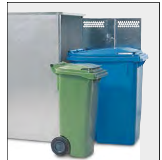
Verzinkte Box mit ausreichend Platz für kleine (hier: 80 Liter) oder große (hier: 360 Liter) Mülltonnen