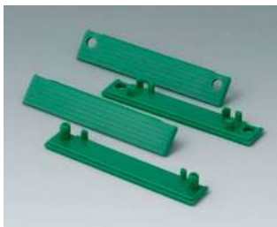
C2201086 Abdeckstreifen 80 PC (UL 94 HB) grün RAL 6024