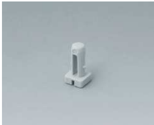
C2299040 Plombierstift PA 6 (UL 94 HB) lichtgrau RAL 7035