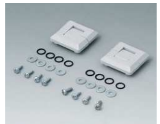
C2299088 Scharnier PA 6 lichtgrau RAL 7035