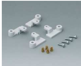
C2299068 Kartenhalter PC (UL 94 HB) lichtgrau RAL 7035

Technische Änderungen vorbehalten. © OKW Gehäusesysteme, Buchen/Deutschland.