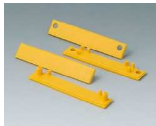
C2201085 Abdeckstreifen 80 PC (UL 94 HB) gelb RAL 1023