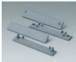
C2201082 Abdeckstreifen 80 PC (UL 94 HB) silbergrau RAL 7001