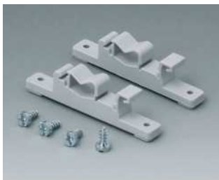
C2201088 Befestigungsteile für DIN- Schienen PA 6 lichtgrau RAL 7035