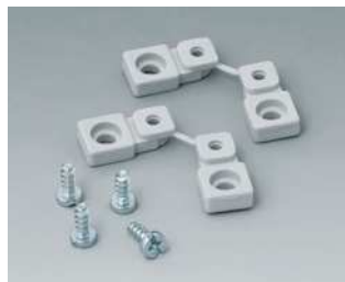
C2299028 Befestigungslaschen PA 6 (UL 94 HB) lichtgrau RAL 7035