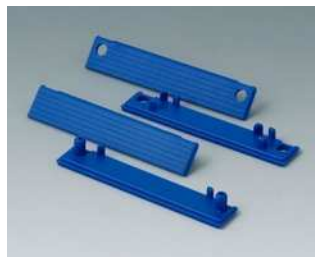
C2201087 Abdeckstreifen 80 PC (UL 94 HB) blau RAL 5017