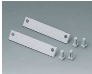
C2299048 Plombiersatz für 80 breit PA 6 (UL 94 HB) lichtgrau RAL 7035