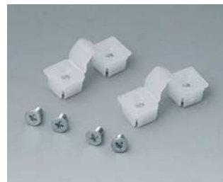
C2299031 Deckelsicherung PP naturfarben