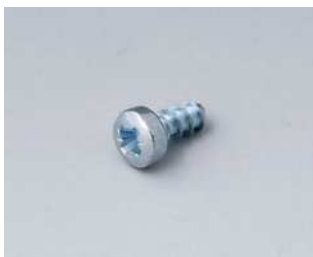
A0306031 Selbstformende Schraube 3 x 6 mm (PZ1)