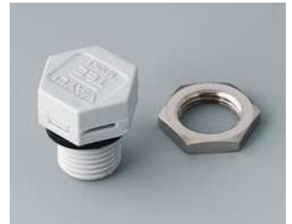
C2310917 Druckausgleichselement M10x1 PA 6 (UL 94 HB) lichtgrau RAL 7035 IP 56