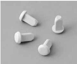
C2299018 Gehäusefüße TPE (UL 94 HB)