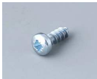
A0308031 Selbstformende Schraube 3 x 8 mm (PZ1)