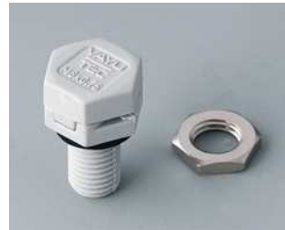
C2306917 Druckausgleichselement M6x0,75 PA 6 (UL 94 HB) lichtgrau RAL 7035 IP 56