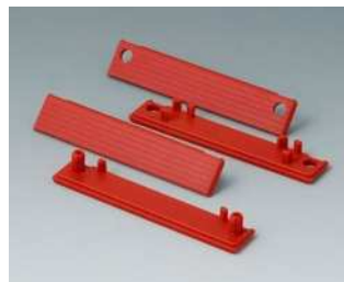
C2201084 Abdeckstreifen 80 PC (UL 94 HB) rot RAL 3020