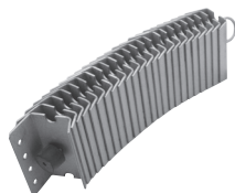
central® PP gestapelt, offen, glatt central® PP stacked, open, even