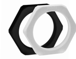
Tipo KGM: ghiera in plastica