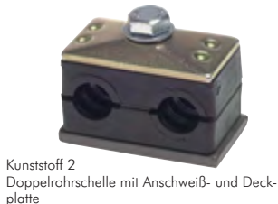
Kunststoff 2 Doppelrohrschelle mit Anschweiß- und Deckplatte