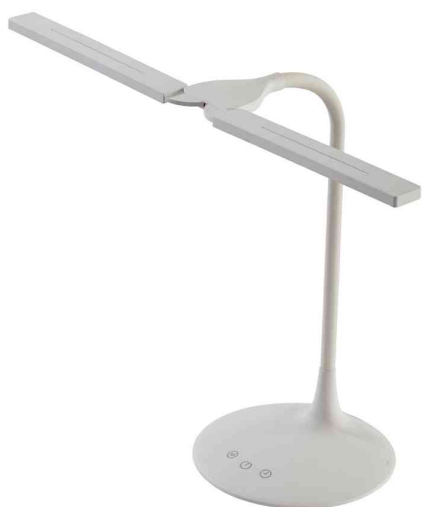
Lampe de bureau LED "LEDTWIN", blanc