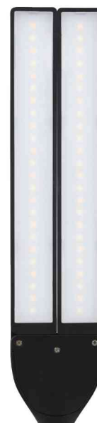
Visuel de référence: Montre les têtes de lampe orientables individuellement