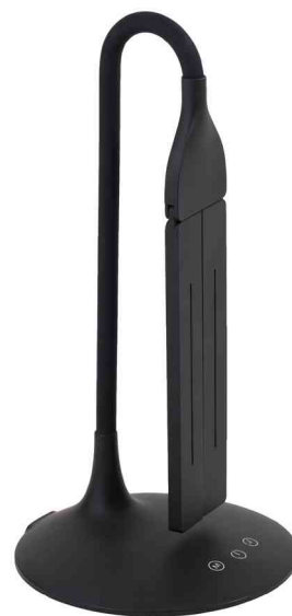
Lampe de bureau LED "TWIN", tête de lampe orientable