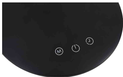
Visuel de référence: Montre le panneau de commande