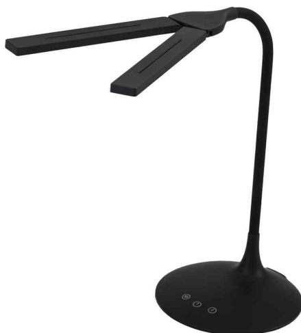
Lampe de bureau LED "LEDTWIN", noir