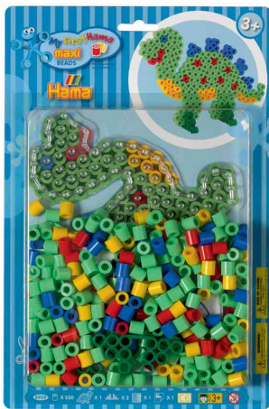
Bügelperlen maxi "Dinosaurier", im Blister

ACHTUNG! Nicht geeignet für Kinder unter 36 Monaten, wegen verschluckbarer Kleinteile.