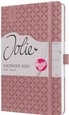
Buchkalender Jolie "Flair", rostraubraun