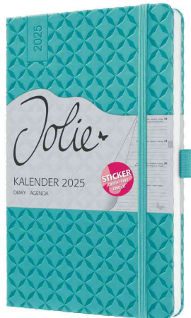
Buchkalender Jolie "Flair", türkis