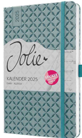
Buchkalender Jolie "Flair", ozeanblau