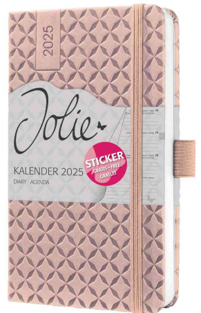
Buchkalender Jolie "Flair", perlmutter