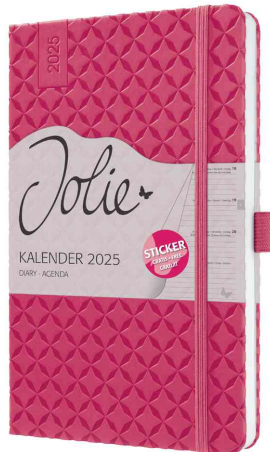
Buchkalender Jolie "Flair", fuchsia