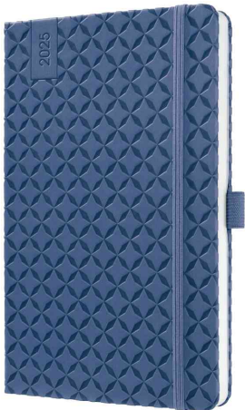
Agenda de poche Jolie "Flair", bleu