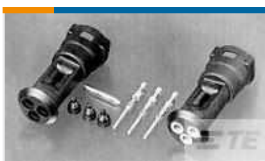
TE Teilnr.:826885-2 3P ECONOSEAL "E"