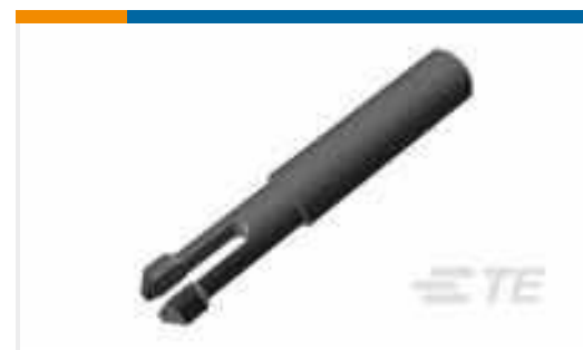
TE Teilnr.:1-640415-1 UMNL KEYING PLUG V2 NATL