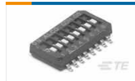
TE Teilnr.:1571983-3 GDH02STR04=DIP SWITCH