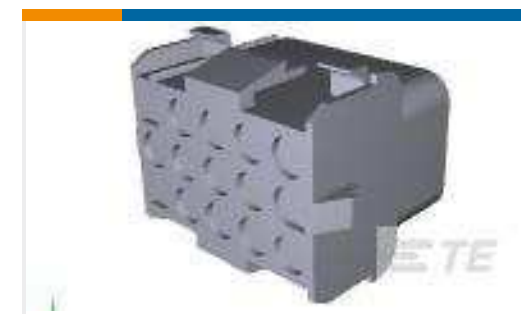
TE Teilnr.:926647-3 UNIV.M-N-L.CAP HSG