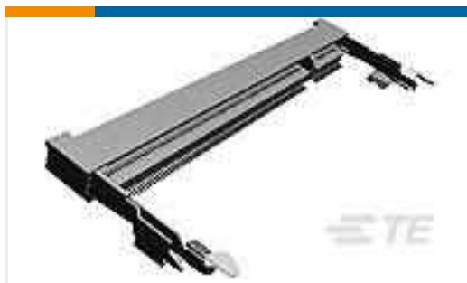
TE Teilnr.:1-1473005-1 SEMI HARD TRAY DDR SOCKET 200P