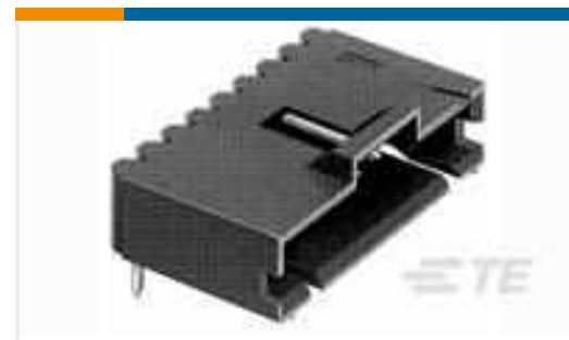
TE Teilnr.:5-103634-5 06 MTE HDR SRRA LATCH.100CL LF