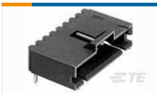
TE Teilnr.:5-103634-4 05 MTE HDR SRRA LATCH.100CL LF