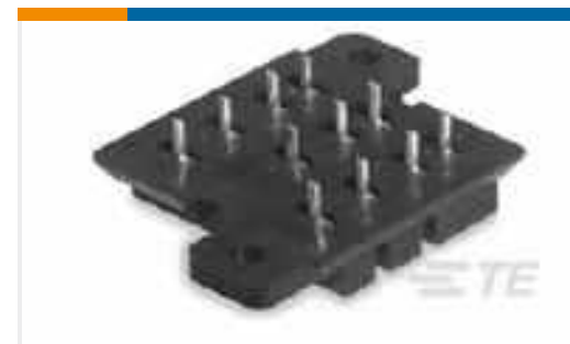
TE Teilnr.:2-1393844-3 RM78702