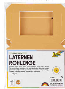
Visuel de référence : emballage