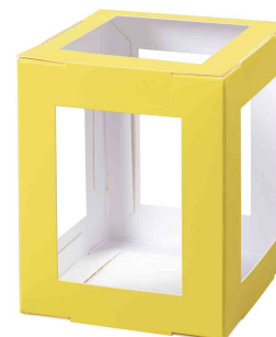
Pièces en carton pour mini lanterne, jaune