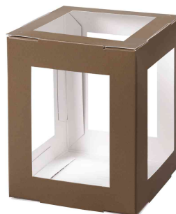
Pièces en carton pour mini lanterne, brun