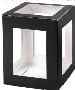
Pièces en carton pour mini lanterne, noir