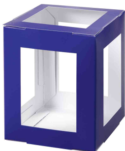
Pièces en carton pour mini lanterne, bleu