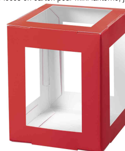
Pièces en carton pour mini lanterne, rouge