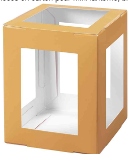
Pièces en carton pour mini lanterne, orange