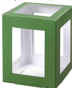
Pièces en carton pour mini lanterne, vert