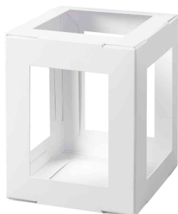
Pièces en carton pour mini lanterne, blanc