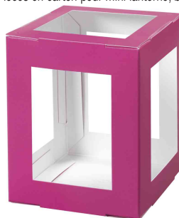
Pièces en carton pour mini lanterne, rose