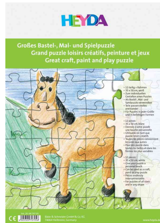
Puzzle vierge, 350 x 500 mm