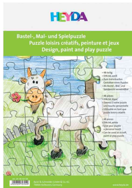
Pièce de puzzle, 210 x 297 mm