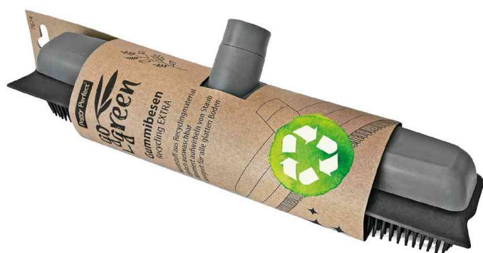
Balai en caoutchouc "GoGreen", emballage