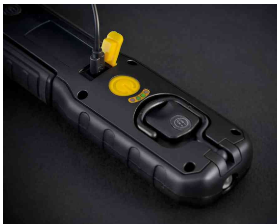
LED Akku-Handleuchte HL 700 A, USB-Anschluss