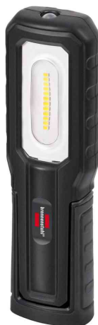
LED Akku-Handleuchte HL 700 A