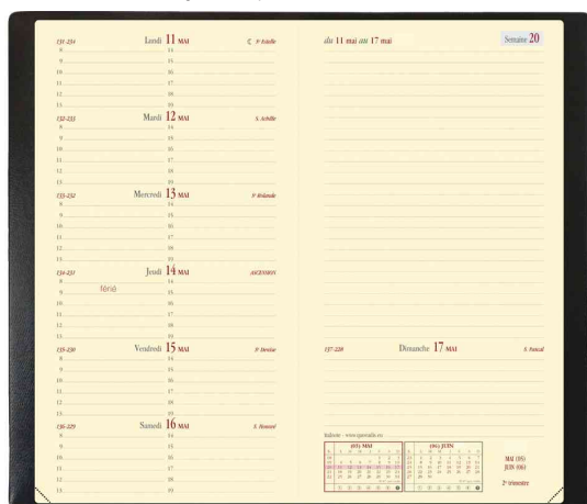
Agenda de poche "Italnote", grille