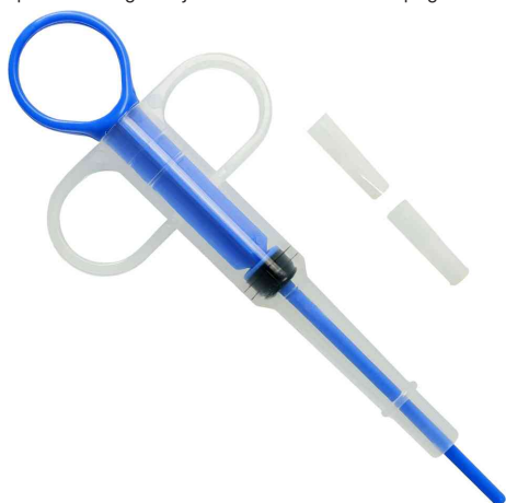
Distributeur de comprimés / d'aliments