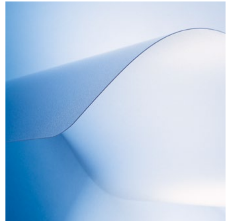
Für Hartböden mit VAB®-Haftschrift