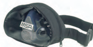
Gürteltasche für Advantage 200 LS