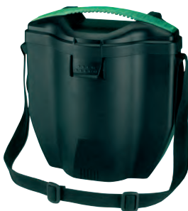
Advantage 3000 Container