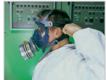
Stellen Sie die Nackenbänder ein

Die Advantage 3000 Vollmasken-Serie bietet nicht nur hohen Schutz, sondern auch einmaligen Komfort. Die weiche Dichtfläche aus gut verträglichem Silikon bietet einen druckfreien Sitz. Die große, optisch korrigierte Sichtscheibe ermöglicht dem Träger eine klare, unverzerrte Sicht. Die grau-blaue Farbe verleiht der Maske ein ästhetisches Erscheinungsbild.