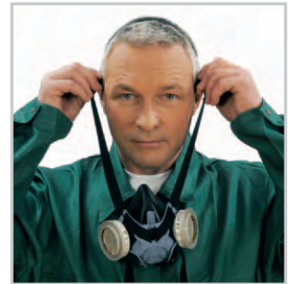
Kopfbänderung über den Kopf ziehen