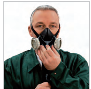
Bänder auf Vorderseite nach unten ziehen und Hebel schließen