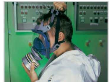
Ziehen Sie die Bänderung über Ihren Kopf