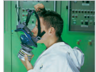
Führen Sie die Kinnlasche über Ihr Kinn