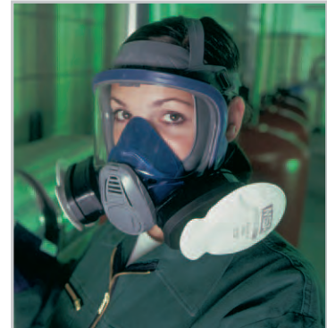
Advantage 3200 mit TabTec und FLEXifilter

Die drei Filterlinien sind für den Gebrauch mit der Advantage 3200, Advantage 200 LS und Advantage 420 geeignet.