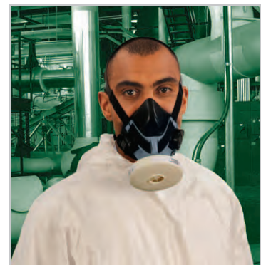
Advantage 410 mit P3 PlexTec Filter

Detaillierte Informationen finden Sie im Prospekt 05-100.2.