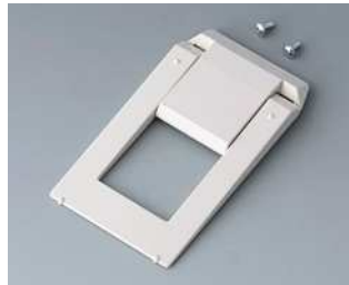
A9250807 Aufstellbügel ABS (UL 94 HB) grauweiß RAL 9002