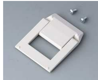
A9250817 Aufstellbügel ABS (UL 94 HB) grauweiß RAL 9002

Technische Änderungen vorbehalten. © OKW Gehäusesysteme, Buchen/Deutschland.