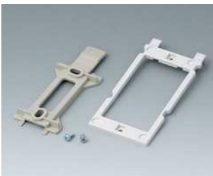
B1350048 Wandhalter-Set ABS (UL 94 HB) kieselgrau RAL 7032