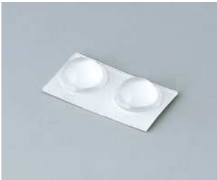
A9210290 Anti-Rutsch-Füßchen 9,5 x 3,8 mm transparent