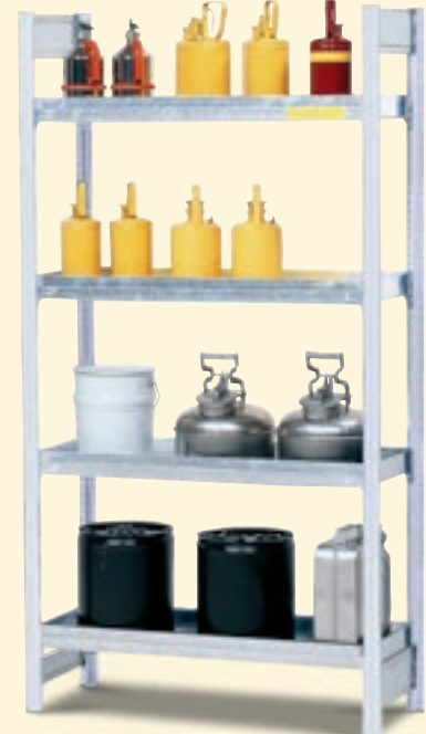
Gefahrstoffregal Typ GRW 1040, Bestell-Nr. 199-566-10

i Alle Regale verzinkt für optimalen Korrosionsschutz