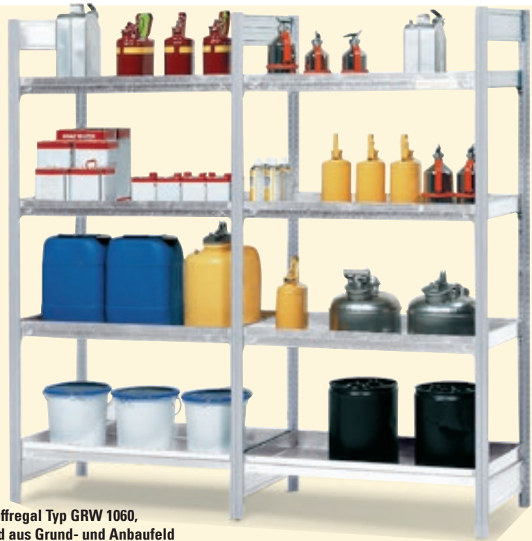
Gefahrstoffregal Typ GRW 1060, bestehend aus Grund- und Anbaufeld