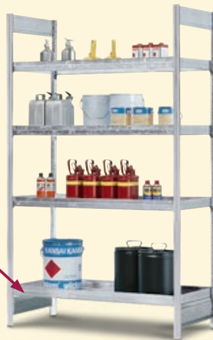
Gefahrstoffregal Typ GRW 1360, Bestell-Nr. 199-574-10