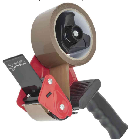
Dévidoir manuel 960 pour ruban d'emballage, équipé