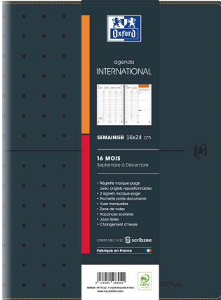
Agenda semainier INTERNATIONAL, 160 x 240 mm