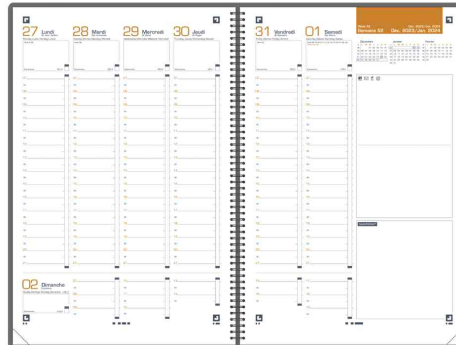
Agenda semainier INTERNATIONAL, grille vue hebdomadaire