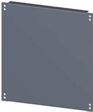
SIVACON, Boden, IP30, T: 500 mm, B: 400 mm, verzinkt