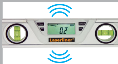
AutoSound bei 0°/45°/90°/135°/180°