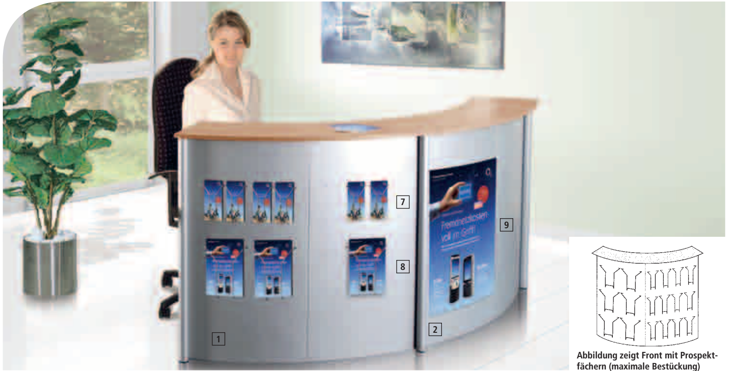
Abbildung zeigt Front mit Prospektfächern (maximale Bestückung)