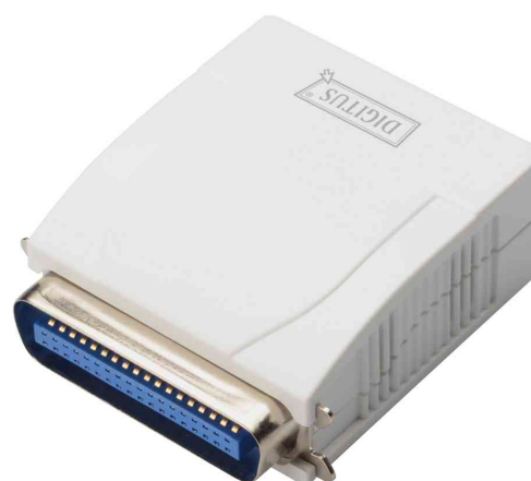
Serveur d'impression Fast Ethernet