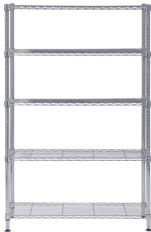
Etagère multifonction MOBI5L