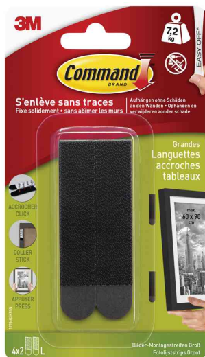
Bilder-Montagestreifen Strips L, schwarz

- geeignet zum Aufhängen von gerahmten Fotos, Bilderrahmen und Grafiken, ohne Schäden an den Wänden zu hinterlassen