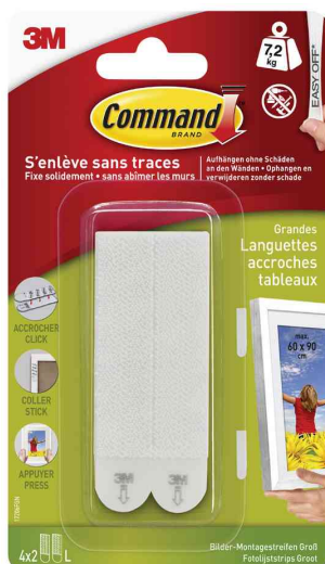
Bilder-Montagestreifen Strips L, weiß