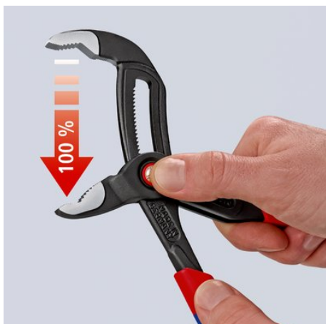
Nyomja meg a gombot, majd nyissa szét teljesen a fogót