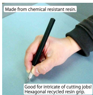
Visuel de référence : incl. 5 lames