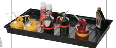
Bodenwanne Typ KB-R 28 aus PE, 28 Liter