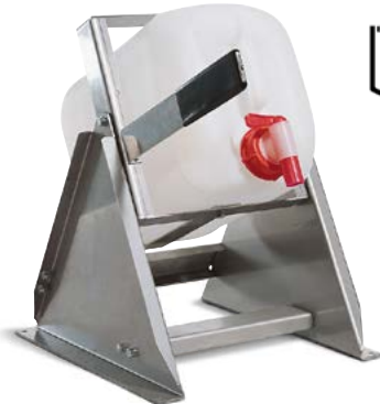
Abfüllbock AB 10-E aus Edelstahl, als Standgerät und zur Wandbefestigung geeignet, Bestell-Nr. 136-491-J0