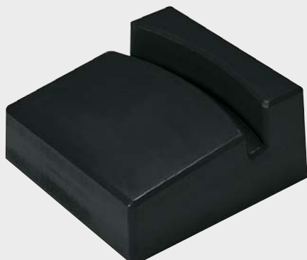
Fasskeil, Bestell-Nr. 114-894-J0