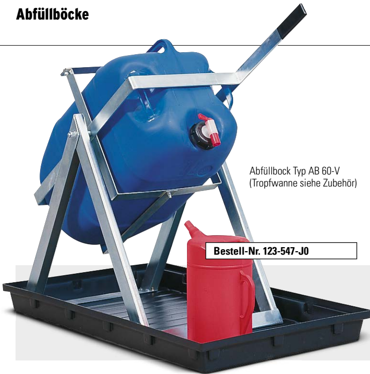
Abfüllbock Typ AB 60-V (Tropfwanne siehe Zubehör)