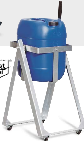
Abfüllbock AB 30-V (Rollen siehe Zubehör), Bestell-Nr. 122-918-J0