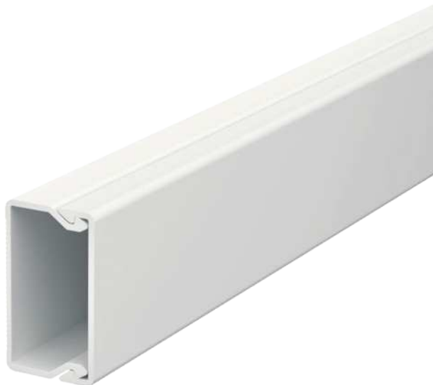
Kanaloberteil und -unterteil mit Bodenlochung.