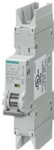
LEITUNGSSCHUTZSCHALTER 10KA, 1-POLIG, C, 35A NACH UL 489 - 277V