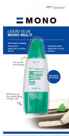
Colle liquide MONO MULTI