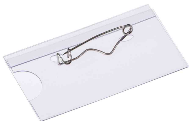
Porte-nom, avec épingle ondulée