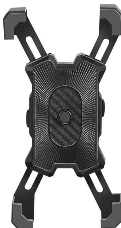
Support de smartphone pour vélo