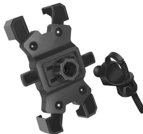
Support de smartphone pour vélo, vue de dos