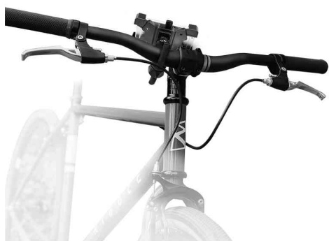
Visuel de référence: présente le produit en utilisation