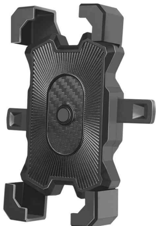
Support de smartphone pour vélo