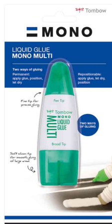
Flüssigkleber MONO MULTI