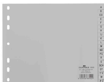
A-Z Kunststoff-Register, halbe Höhe, grau