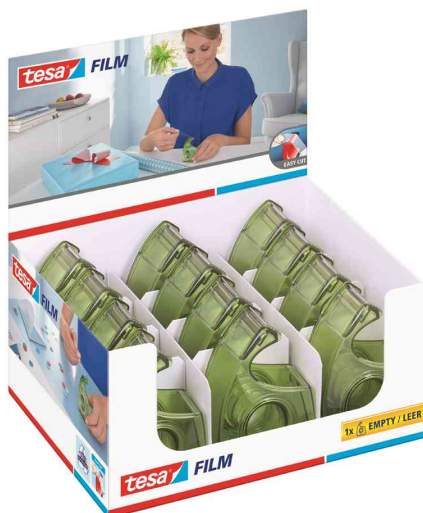
tesa ecoLogo® Easy Cut Dévidoir à main présentoir de comptoir