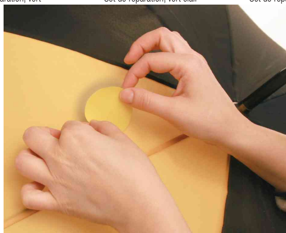
Visuel de référence : montre le produit en utilisation