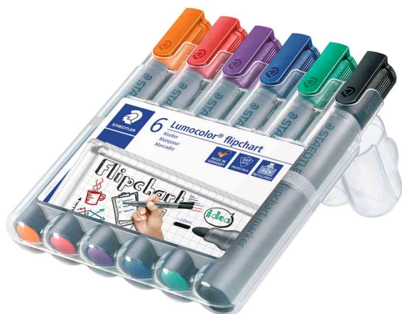
Marqueur de conférence 356 Lumocolor, étui de 6