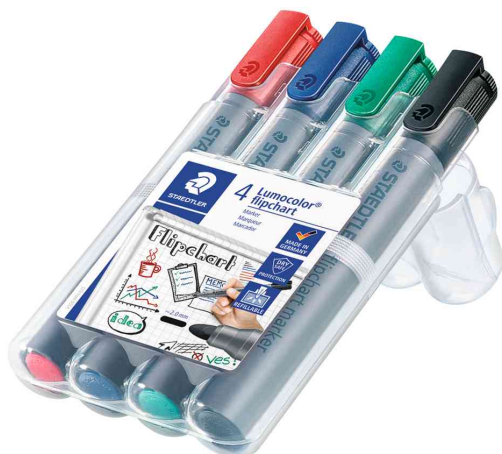
Marqueur de conférence 356 Lumocolor, étui de 4 (5653312)