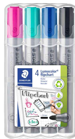
Marqueur de conférence 356 Lumocolor, étui de 4 (57890678)